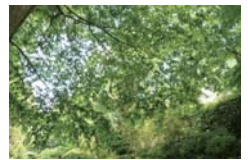
南川溪谷、新緑の カーテンが涼しく マイナスイオンを 感じます。