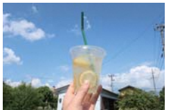
青空をバックに アドフルのお手製 レモンスカッシュ