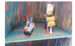
ゴア・ガジャの 可愛い置物たち

夕方にも焼きたてパンを 購入できるパン屋さん。 メープルブレッド、カレ ーパン、ピザパンなど、 甘い系から惣菜系まで種 類豊富。クリームボック スはトーストされた香ば しいパンとあっさりとお いしい風味のミルククリ ームが相性抜群です！